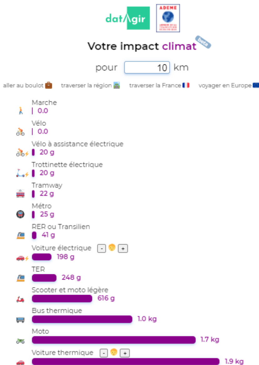
Tableau émission CO2 par mode de déplacement. (Exprimé en gramme éq CO2/km par passager/km) Les données utilisées sont accessibles sur le site : https://datagir.ademe.fr/apps/mon-impact-transport/

Méthode de calcul économie de CO2 réalisée (VS l'usage de la voiture individuelle). En moyenne une voiture individuelle à un taux d'émission de 150gCO2/km. Sur une distance de 10 km, En voiture individuelle : nous avons donc 150g*10km soit 1500g pour 10km. Soit un total de 1,5kg d'émission de CO2. En marche seule : la consommation de CO2 étant nul, on économise 1,5kg d'émission de CO2 pour un trajet de 10km. Pour un trajet multimodal avec 2 km de marche puis 6 km de train et 2 km de tramway. Nous avons (2*0g)+(6*1,9g)+(2*3,3g) soit 18g d'émission CO2. L'économie est donc de 1500g-18g = 1482g d'émission CO2 par rapport à la voiture individuelle.